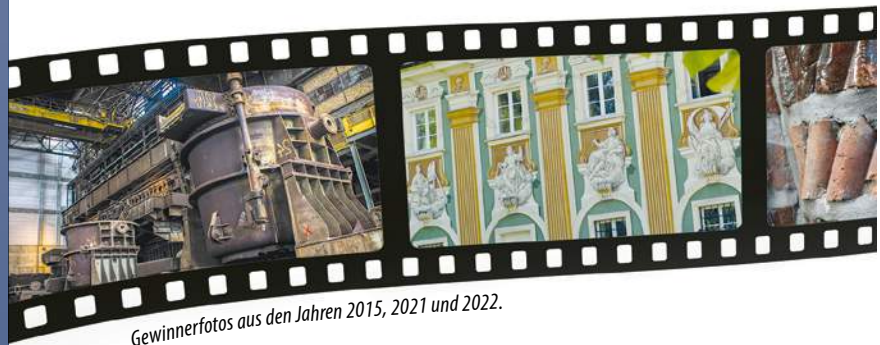
Gewinnerfotos aus den Jahren 2015, 2021 und 2022.

Die bundesweite Foto-Aktion zum Tag des offenen Denkmals® geht in die nächste Runde! In diesem Jahr suchen wir spannende Motive zum Motto „Talent Monument“.