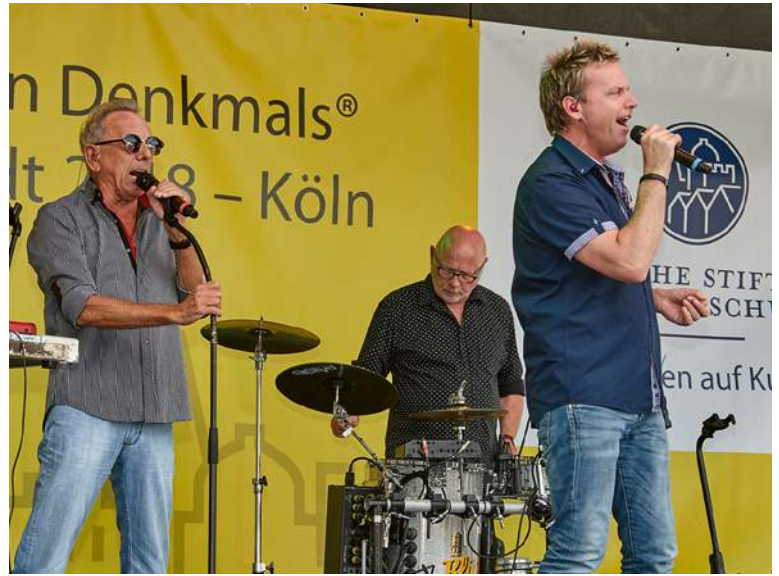
2018: Die Bläck Fööss zur Eröffnungsfeier in Köln.