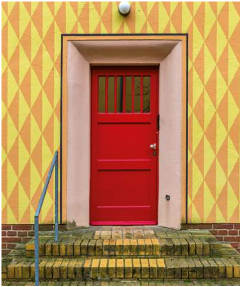
2014: Das bundesweite Motto setzt farbige Akzente.