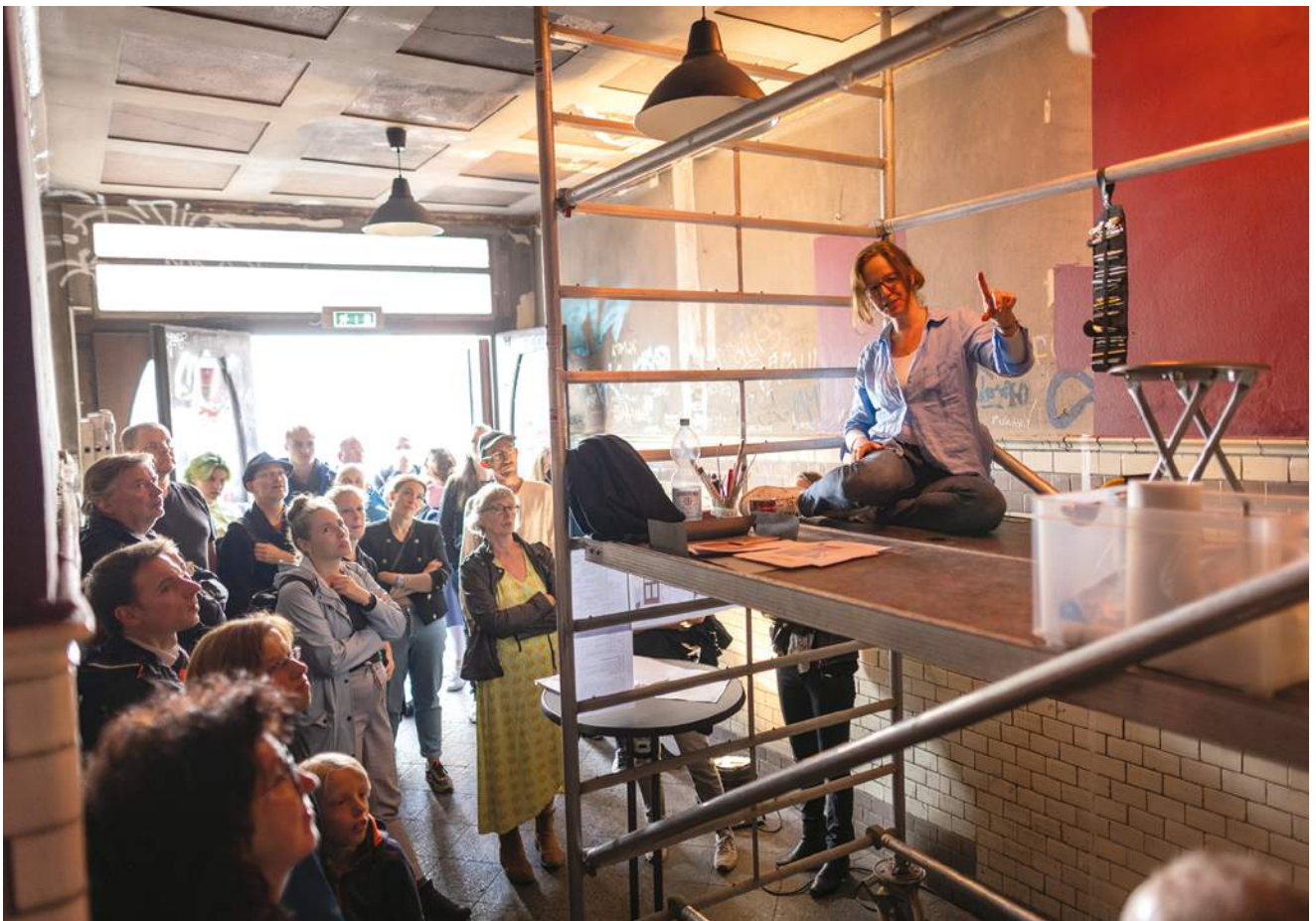
2022: Insgesamt sieben Schaubautstellen werden in Leipzig präsentiert.